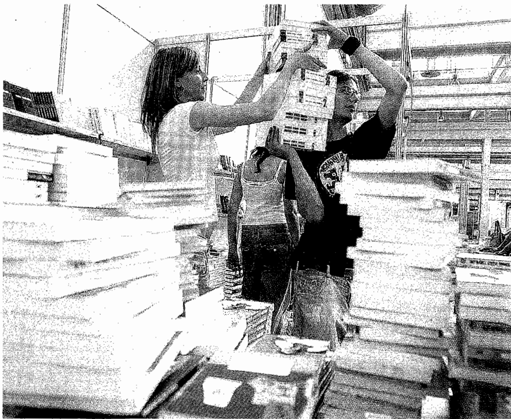
Allestimenti della Fiera del Libro 2007

zione e coloro che non posseggono altro bene che la forza lavoro. Ma non c'è dubbio che viene rafforzato dal pregiudizio per cui le due classi contrapposte si attribuiscono reciprocamente caratteri soltanto negativi.